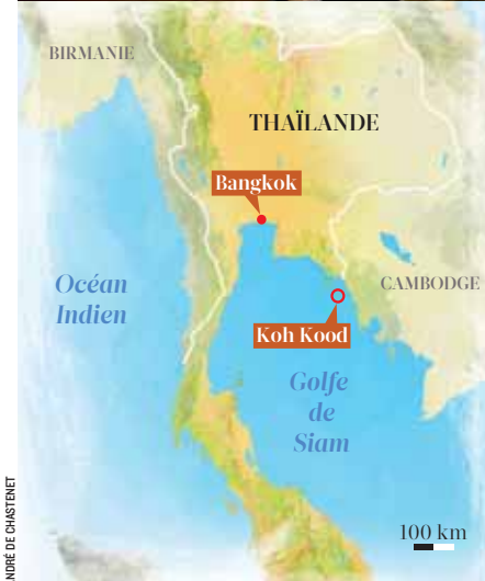
ANDRÉ DE CHASTRIET

(Hill Villa). Une douzaine de catégories de villas (et donc de tarifs), avec options spa, bibliothèque, salle de gym... Toutes sont équipées d'écrans LCD (subtilement cachés), du Wi-Fi ou du câble, de station iPod, de système hi-fi Bose, de machine expresso... Pour la restauration, on passe du dîner gastronomique au pique-nique sur la plage, du barbecue au potager, du buffet asiatique au repas privé servi